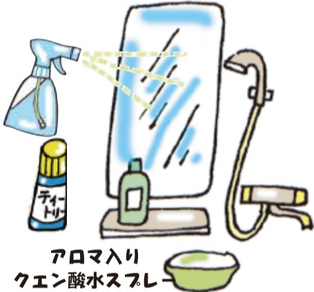
アロマ入りクエン酸水スプレー