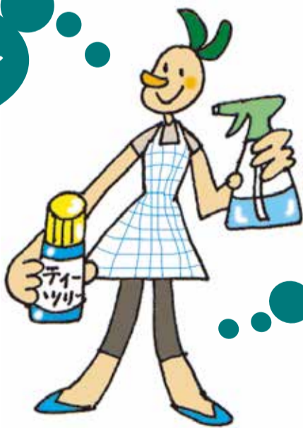
クエン酸水スプレー

アロマ入りクエン酸水： 水1カップに対し、クエン酸小さじ1とエッセンシャルオイル1〜5滴を加えます。