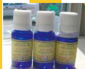
●エッセンシャルティートリー

殺菌効果があるアロマを加えるとカビ除去対策がアップ、さらにウイルス対策にもなりますね〜お風呂場やキッチンのお掃除に。