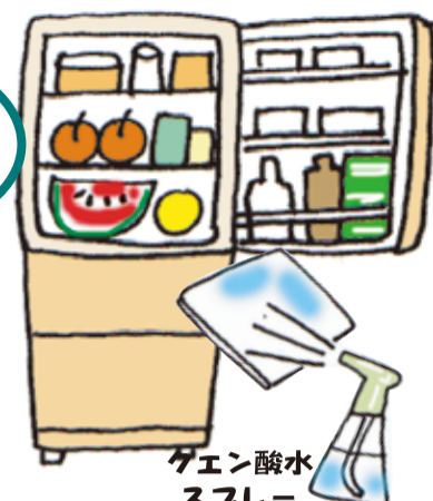
クエン酸水スプレー