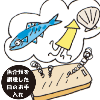
魚介類を調理した日のお手入れ