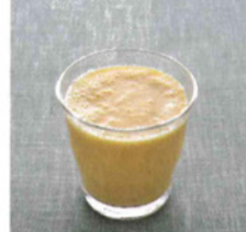
柑橘系スムージー

《材料》たんかん50g、文旦50g、バナナ30g、ヨーグルト大さじ1、インカインチプロテインパウダー小さじ1、氷 適宜