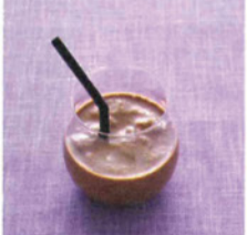
ココアスムージー

《材料》バナナ40g、りんご40g、インカインチプロテインパウダー小さじ1、ココア小さじ1、氷 適宜