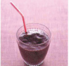
アサイスムージー

《材料》アサイビュレ25g、いちご3粒(70g)、りんご40g、インカインチプロテインパウダー小さじ1、氷 適宜