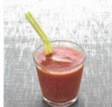
キャロットスムージー

《材料》人参50g、トマト40g、パプリカ10g、インカインチプロテインパウダー小さじ1、氷適宜