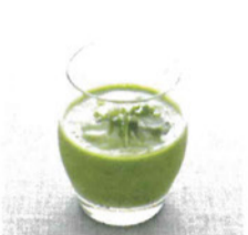
グリーンスムージー

《材料》小松菜15g、ルッコラ15g、バナナ30g、パイナップル30g、インカインチプロテインパウダー小さじ1、氷 適宜