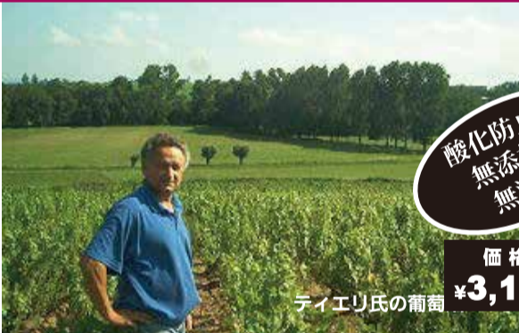
ティエリ氏の葡萄