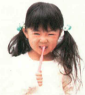
ミント味が苦手なお子様は少量で♪

洗浄力がパワフルな『バイオペースト』は、少ない使用量で十分♪ 60gサイズでも思いのほか長持ちして経済的です。スーッと深呼吸したくなるようなミント味の爽快感がお好きな方はたっぷりお使いいただいても◎。歯磨きを終えた後は、もう一度歯に塗っておくことで、雑菌が繁殖しにくい環境を維持できます。