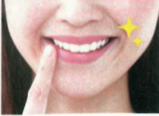
バイオミネラルの働きで美しくキレイな歯に!

『バイオペースト』は、pH10以上という強いアルカリによって、しっかり汚れを落としながらも、粘膜や歯は傷つけないのが特長です。界面活性剤や、フッ素、研磨剤不使用でも口内の汚れを強力に除去して雑菌もクリーンに♪ 使用後は歯をイオンバリアがコーティング。歯垢や歯石の再付着を防ぎます。