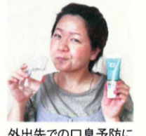
外出先での口臭予防にも抜群の威力を発揮!

食後に起こりやすい歯のエナメル質を溶かす酸性環境も、強アルカリ性の『バイオペースト』で素早くリセット! 少量を口の中に馴染ませて、水で軽くゆすぐとマウスウォッシュとして使えます。外出先でのエチケット用、ウイルス対策としても大活躍。カバンにひとつ入れておくと便利ですよ!