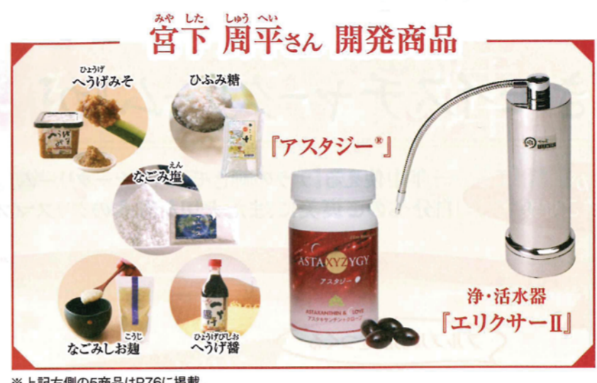
※上記左側の5商品はP76に掲載。

※生命体の発するサインを同時にダイレクトに感じ取る「まほろば0-1テスト」(登録商標2003-077301)