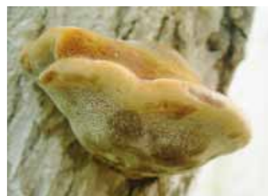
野生のメシマコブ子実体

今回「ユットク」に使われているメシマコブは、中国福建省産の野生の子実体(メシマコブのもの)で、大変珍しく貴重なもの。しかも、多糖類のβ-グルカンを多く含有する高品質のものです。