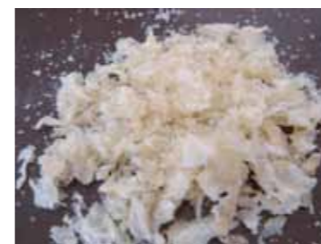
糖鎖やシアル酸の宝庫「燕窩」

さらに、燕窩は「EGF様物質」を含み、美容業界からも注目されています。栄養分析では水溶性タンパク質60%、多種のアミノ酸(シアル酸)と水分10%、他に繊維質、炭水化物、少量の脂質、さらにカルシウム、ビタミンB1、カリウム、リン、ヨウ素などのミネラルも含まれています。